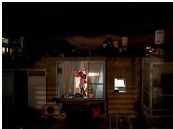
מתוך סדרת 'בין השמשות'

מנחה: אוהד אשר צלם, אמן, אוצר. בונה מכשירי התבוננות. תערוכות יחיד: 'מנשר' (15), המדרשה (14). סרט דוקומנטרי 'רח' הרצל (11). אוצר גלריה התחנה המרכזית (15-16), מרכז מגמות צילום בתיכונים שוני. ב.א. ויצו חיפה (07)