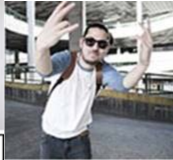
אורטגה, יהונתן יהודאי, זמר וראפר ישראלי לינק לויקיפדיה