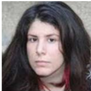
סיוון שיקנאי, סופרת, משוררת ותסריטאית. לינק לויקיפדיה