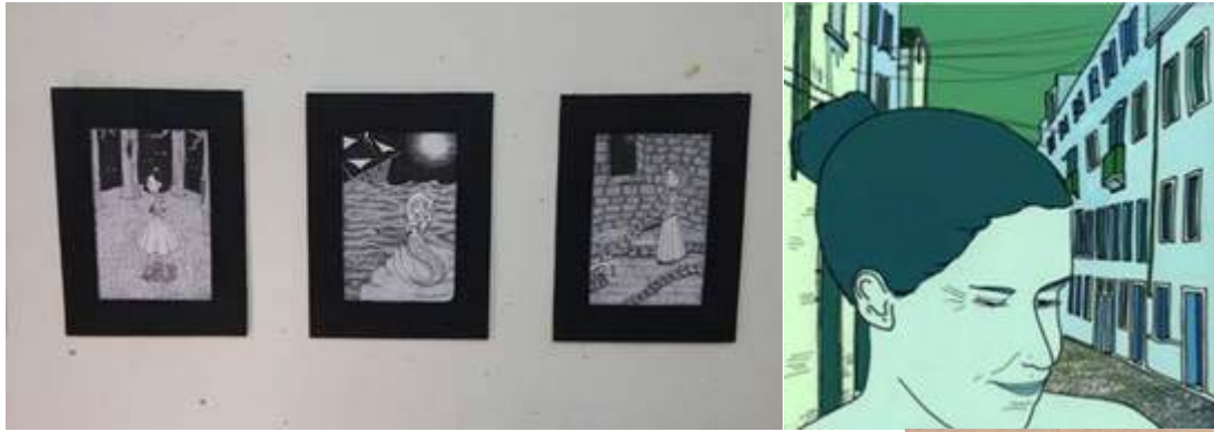
טל לוטן ושני ניסים – איורים מהקורס