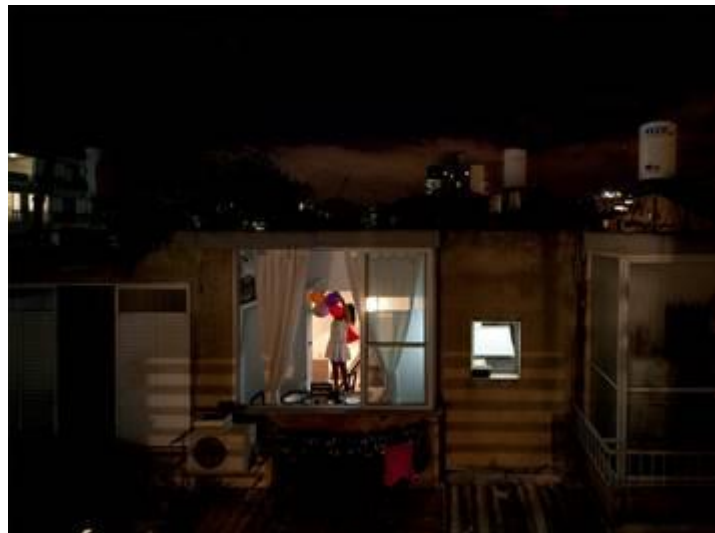
צילום: אילן כרמי, מתוך סדרת 'בין השמשות'

במהלך הקורס ירכשו הסטודנטים ידע טכני בהפעלת המצלמה בתנאים המאפיינים: רחוב, שדרה ושדה הפתוח – כמו גם מקומות ציבוריים סגורים ובבתיים. סמ' א': בניינים ורחובות, כיכרות ונמלים, נושא ורקע, זווית ופרספקטיבה, אור וצל, קומפוזיציה, תחבורה ותנועה, תפיסת הרגע, אנשים, דמויות, בעלי חיים, שיגרה. מבחינה טכנית יתרכז הקורס במדידת אור, מיקוד ואורך מוקד, מהירות, תוכנות במצלמה ועוד. סמ' ב' יפגיש את הסטודנטים עם הצד האישי והאמנותי של המדיום. כיצד להתבונן בעולם, מתי לעצור אותו על מנת לייצר דימוי צילומי שעונה לכוונות, מהי המשמעות של הבעות פנים, מהי המשמעות של מחוות גוף, מהי המשמעות של יחסים כאשר הם מוקפאים לחלקיק שניה מכריע. תרגילים לדוגמא: צילומי פנים בית, משפחה, דיוקן עצמי וזהות עצמית, צילום חפצים ומשמעותם, וכו'. מועד: ימי חמישי 18:30-21:00. הקורס משלב יציאות לצילום בימי שישי בבוקר תאריך פתיחת הקורס: סוף אוקטובר 2019 מחיר: 3,400 ₪ כולל דמי הרשמה. אין חיוב במע"מ. תשלומים: מתאריך הרשמה עד אמצע מאי. מנחה: אוהד אשר. צלם, אמן, אוצר. בונה מכשירי התבוננות. תערוכות יחיד: 'מנשר' (15), המדרשה (14). סרט דוקומנטרי 'רח' הרצל (11). אוצר גלריה התחנה המרכזית (15-16), מרכז מגמות צילום בתיכונים שוני. ב.א. ויצו חיפה (07)